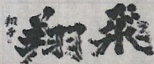
■ 金澤翔子 / 翔飛(真筆)