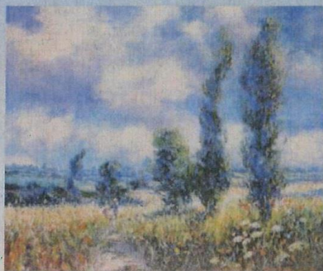
ジャネット・ルール / 夏の静かな風景、美しい真っ赤なポピー(油彩15F)

会場 サンパティオホール「ほのぼの」多目的ホール 豊中市庄内西町3-1-5 サンパティオ3階 TEL.06-6334-1331 ●阪急宝塚線庄内駅下車、徒歩1分