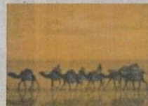
■ 平山 徳夫 / 流沙浄土変(巧筆)