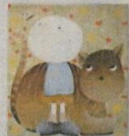
■ マッケンジー・ソープ / 猫と男の子(ジクレ)