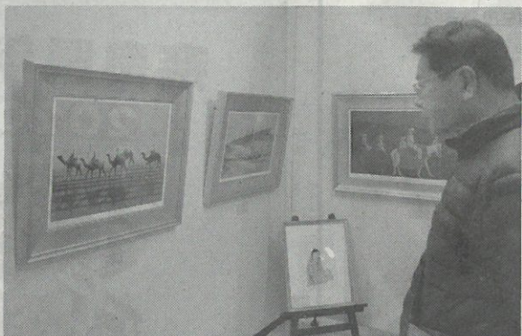
仏教やシルクロード、奈良の社寺などが色鮮やかに描かれている平山郁夫版画展=奈良市登大路町の県文化会館2階展示室C

奈良新聞社など後援)が奈良市登大路町の県文化会館2階展示室Cで開かれている。平山氏の版画作品53点を展示。どの作品も穏やかで、平和を願う氏の思いが伝わってくる。入場無料。13日まで。予約販売される作品の収