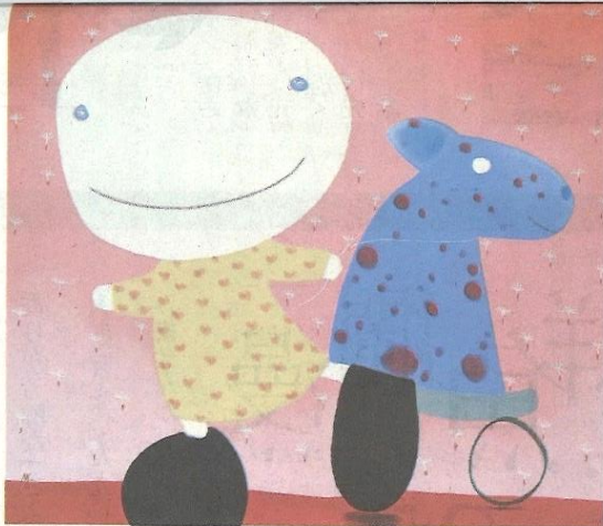
ソープさんの作品「風に乗る希望」