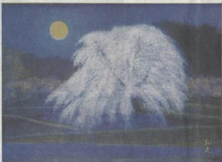
平山画伯最晩年の作「万葉月華図」