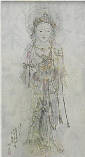
平山郁夫「敦煌菩薩像」

取益から日本ユネスコ協会の東日本大震災子ども支援基金に寄付しようと、今回は自ら主催の絵画展でチャリティー絵画展の企画・運営事業も行って「親善大使」として世界のやいども、保育園、ラオス跡の保護にも力を文化イオンスクラブなどの奉仕活動から、平山画伯の仕団体が主催するチャリティー作品を展示販売し、その