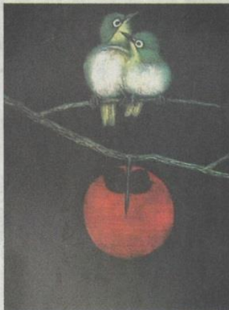
加山又造「KAKI」(一部拡大)