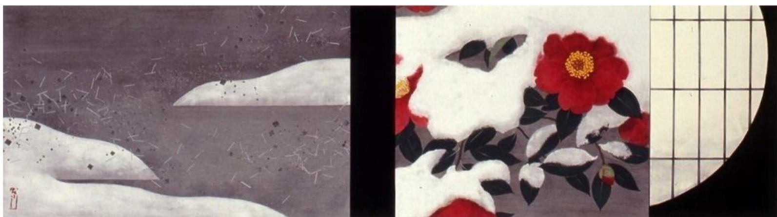
冬日 四季シリーズ(冬) イメージサイズ 19.5×70cm 限定 180部 税込価格 ¥187,000

冬の日、窓から覗く雪の庭。全てが白く覆われるなか、椿の赤がより美しさを増す。冬ならではの美を感じ、絵にした。