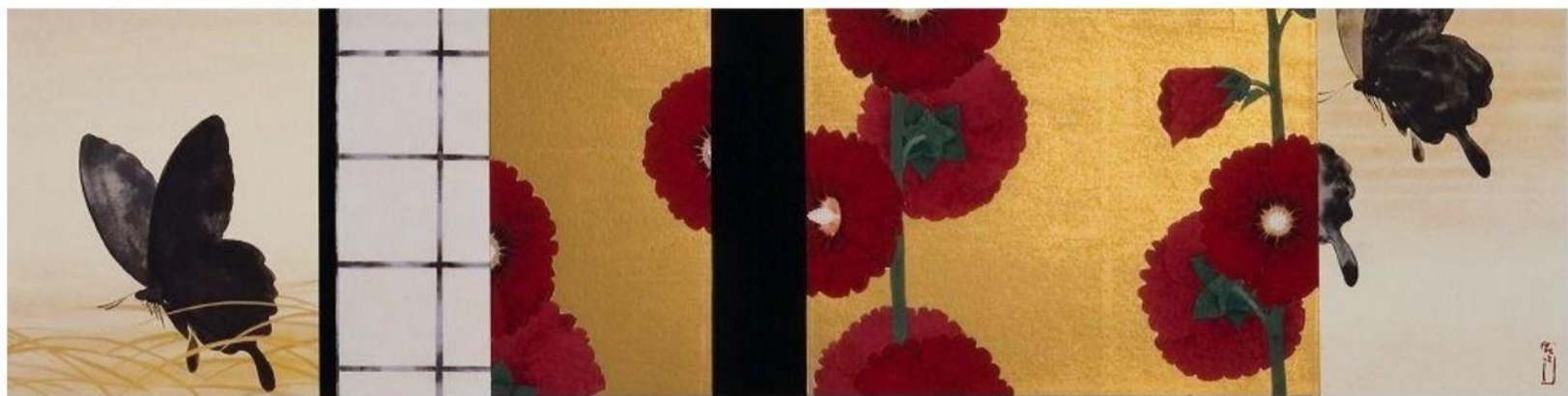
午後の風 四季シリーズ(夏) イメージサイズ 17.9×72cm 限定 180部 税込価格 ¥187,000

枕草子にあるように、春のもっとも良い情景とされる明け方の景。昨夜の月の光の中、桜を眺めたことを思い出しつつ。