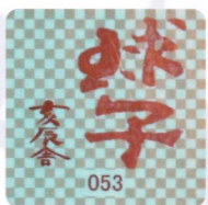
▲朱印の下(額装内)に偽造防止のためのホログラムが付けられています。